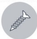
Саморезы с потайной головкой 16 мм *4 шт.